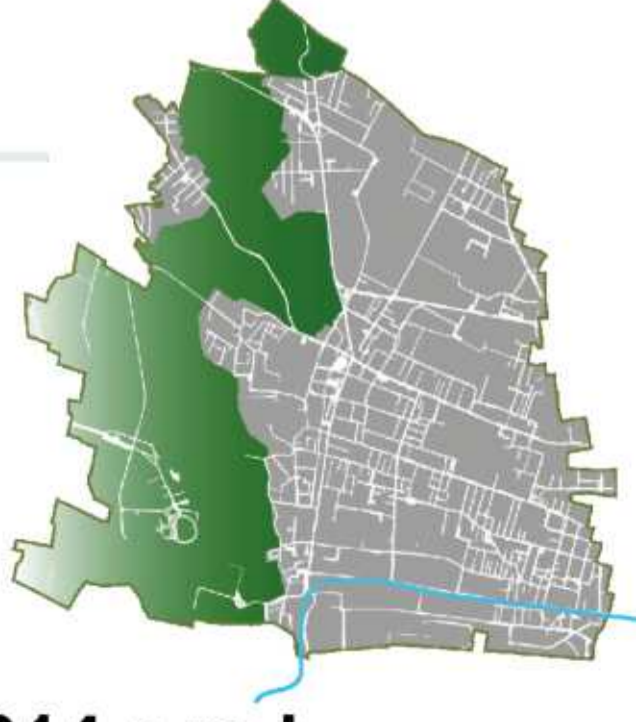
Tavola PR05.3 Scala 1: 1.000 Caratteri degli Spazi aperti dei NAF