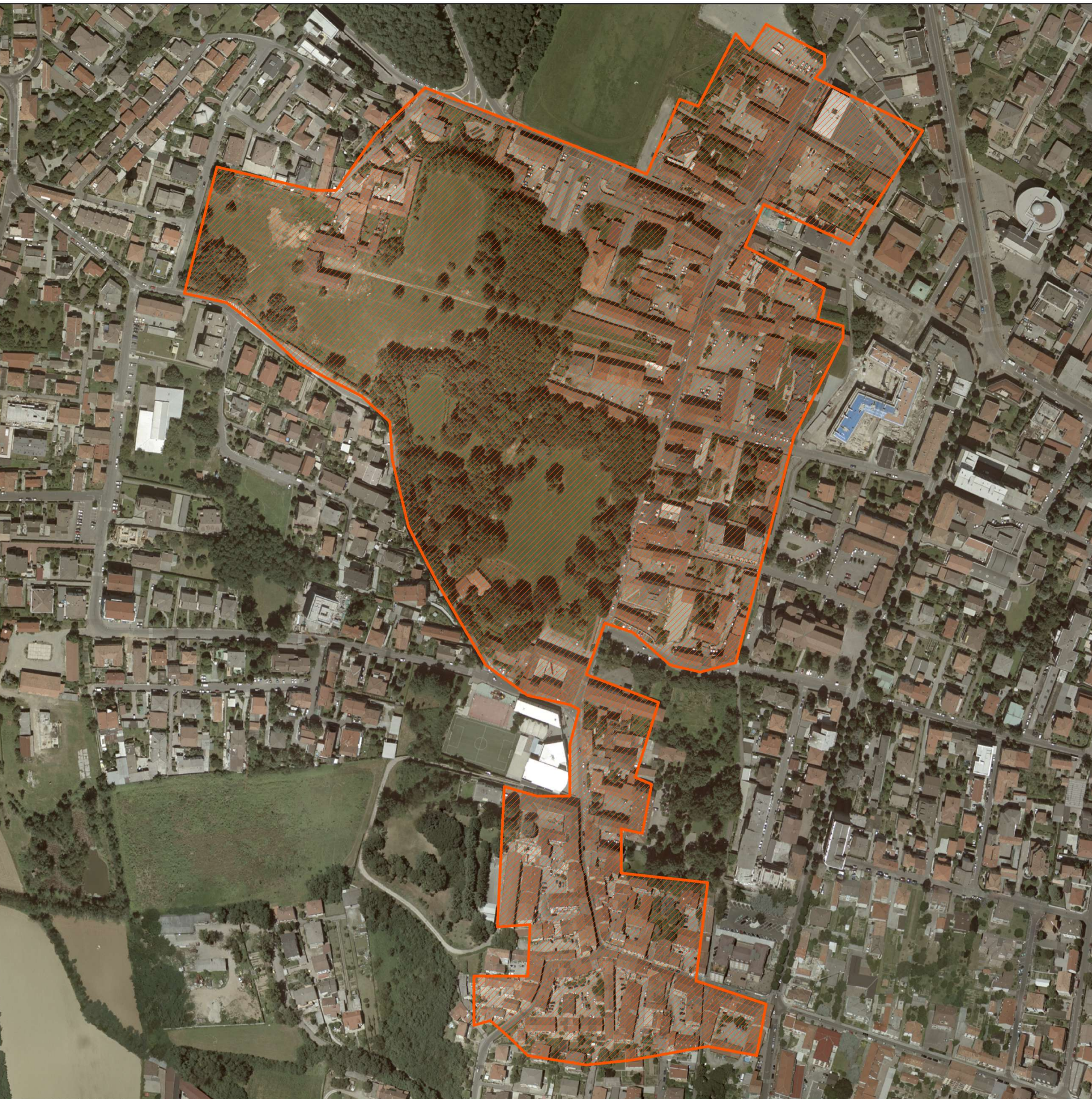
Centro storico Pinzano